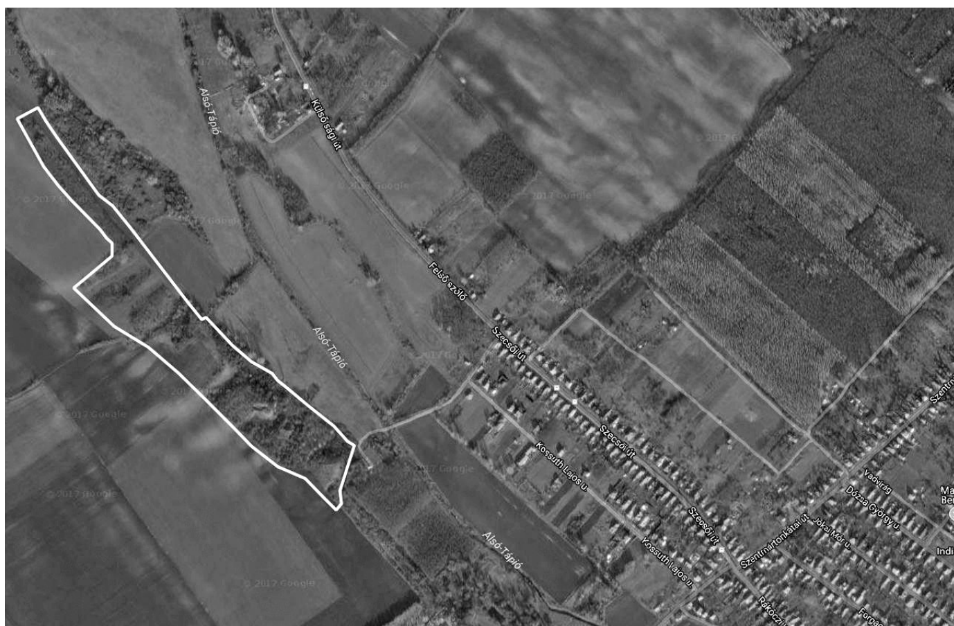
Fotó: légi felvétel a Tápiósági Földvár, illetve annak közvetlen védőzónájáról (az ex lege védett terület határa)